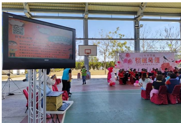
活動現場於電視播放登月計畫簡報