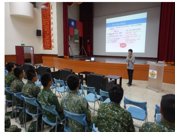
於軍方辦理性平講座宣導