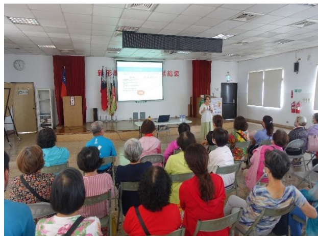
於農會辦理性平講座宣導