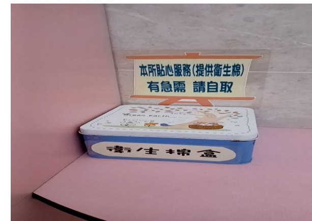
公廁放置生理用品提供民眾使用