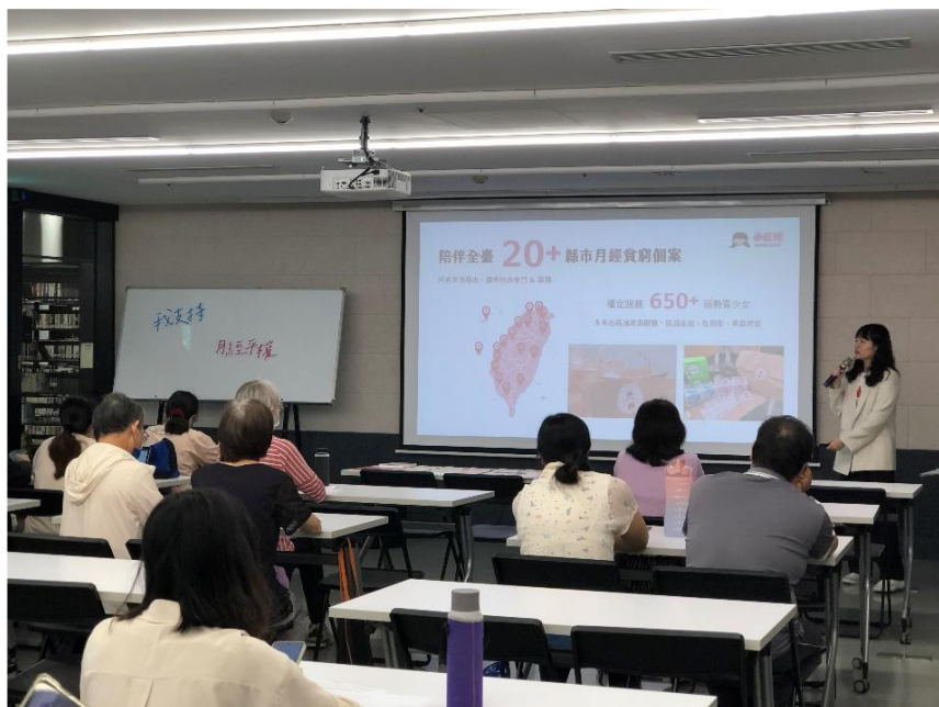
112年本府性別平等辦公室邀請 全球小紅帽協會辦理專題講座