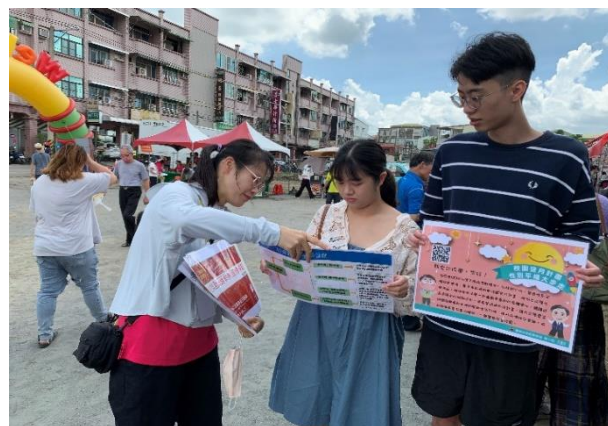
活動設攤向民眾宣導