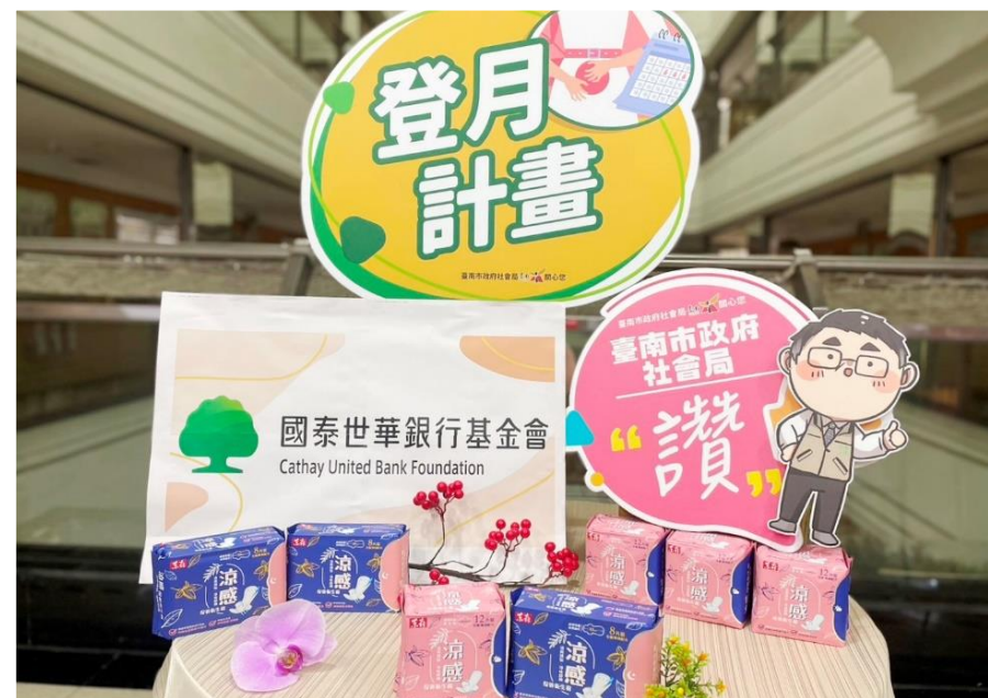
112年國泰世華銀行基金會捐助臺南市 政府社會局及教育局生理用品