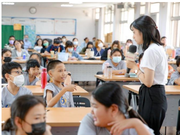
學校宣講月經教育課程